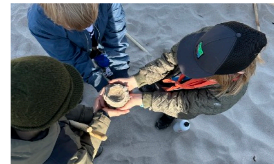
Klubliv og forventninger