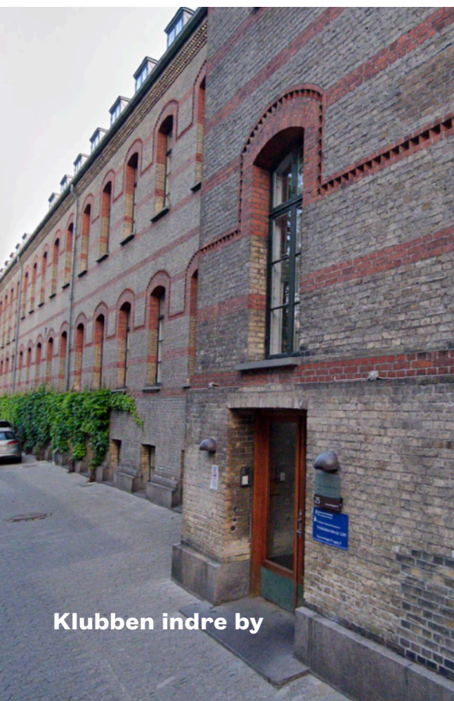
Klubben indre by