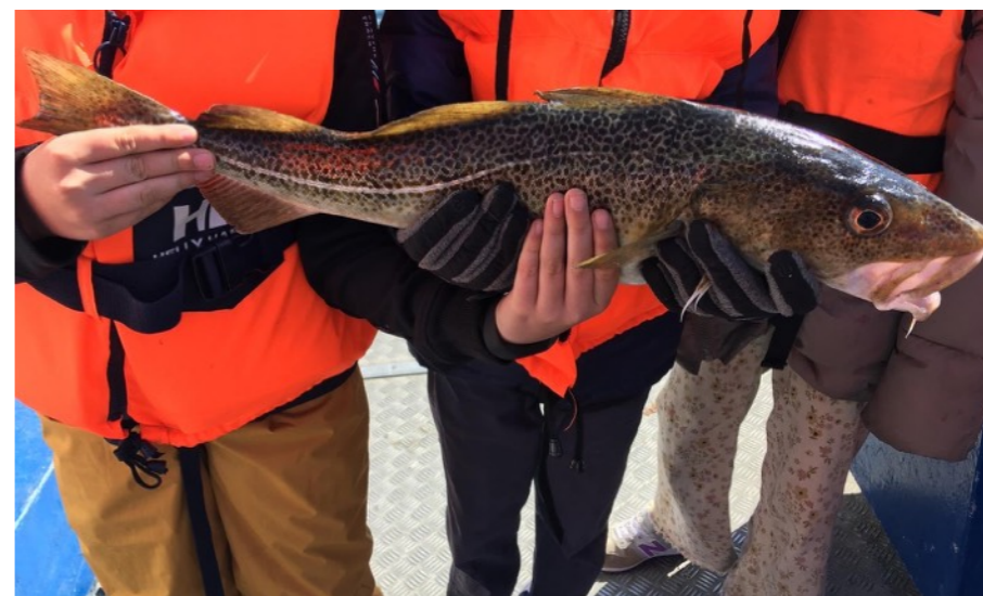
Klubliv og forventninger