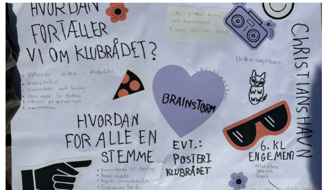
Klubliv og forventninger