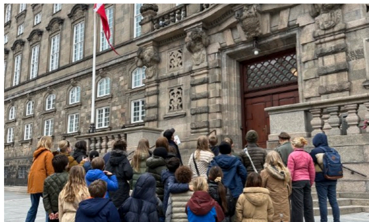
Klubliv og forventninger