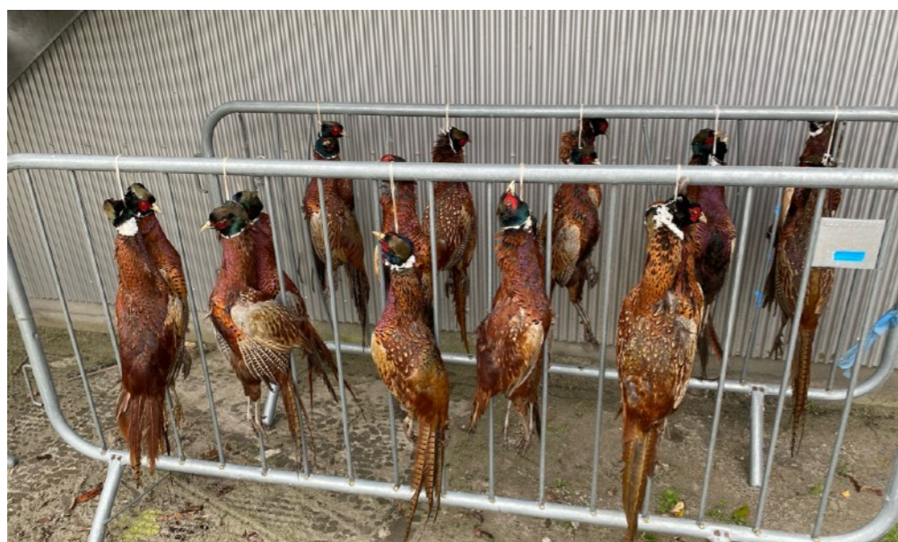
Klubliv og forventninger